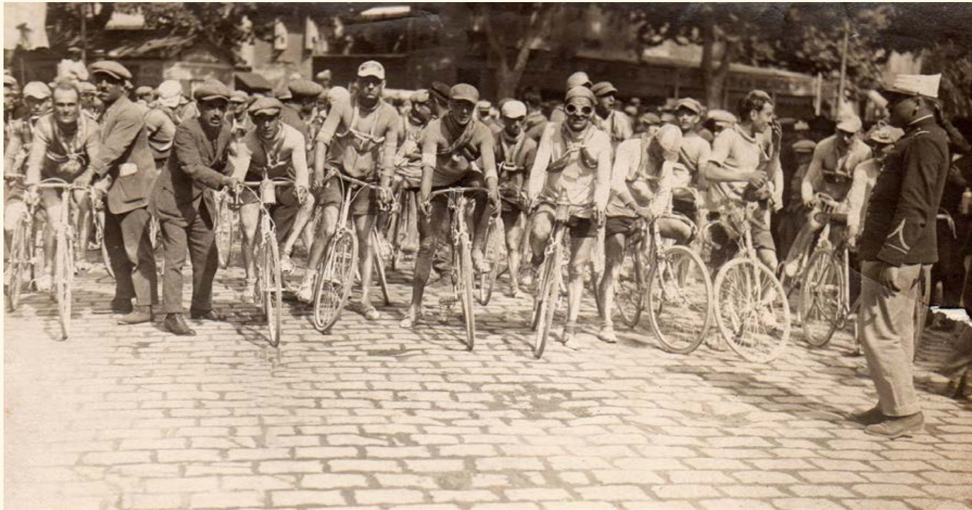
Départ course de vélo - 1922 - ©service archives-patrimoine Aubagne-en-Provence

Alors sortez vos plus belles tenues d'époque, et participez à cette grande manifestation historique !